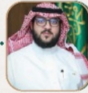
كلمة رئيس مجلس الإدارة